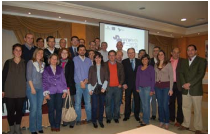
Integrantes del Proyecto WINETech.