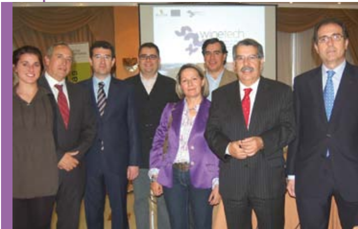
Integrantes del Proyecto WINETech en Castilla-La Mancha

El evento acogió la primera reunión presencial de los miembros del Comité Asesor, órgano de asesoramiento y consulta del proyecto, formado por personas con amplio conocimiento del sector. Tras una ronda de presentaciones de perfiles y entidades representadas por los participantes y el análisis de acciones y visión general de WINETech, se debatieron las propuestas sobre el plan de sostenibilidad de la Red de Servicios de I+D+i; es destacable la clara intencionalidad de los allí presentes en la búsqueda de líneas de financiación para