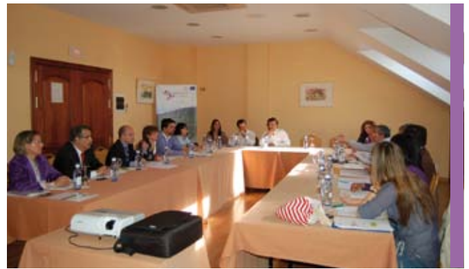
Reunión del comité WINETech en Ciudad Real

ofiralia s.l. SUMINISTROS DIGITALES INTEGRADOS