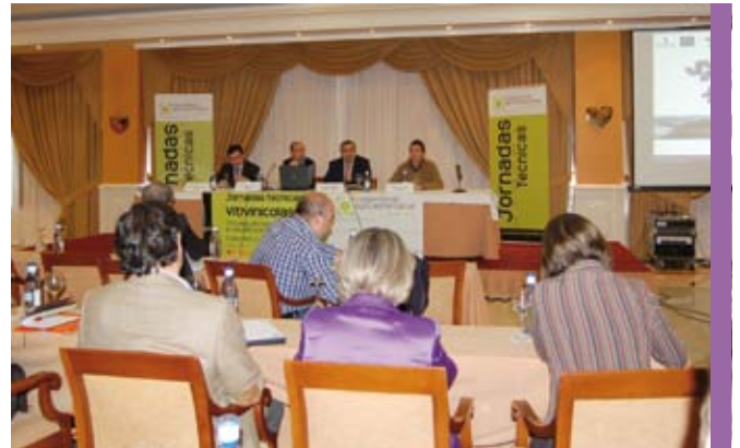
Ponencia sobre viticultura por teledetección.

Ciudad Real se convirtió durante los días 5 y 6 de mayo en un escenario tecnológico del sector agrario, dirigido fundamentalmente a cooperativistas