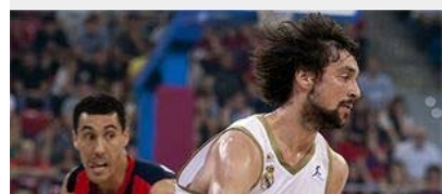
EL REAL MADRID FUERZA EL QUINTO PARTIDO